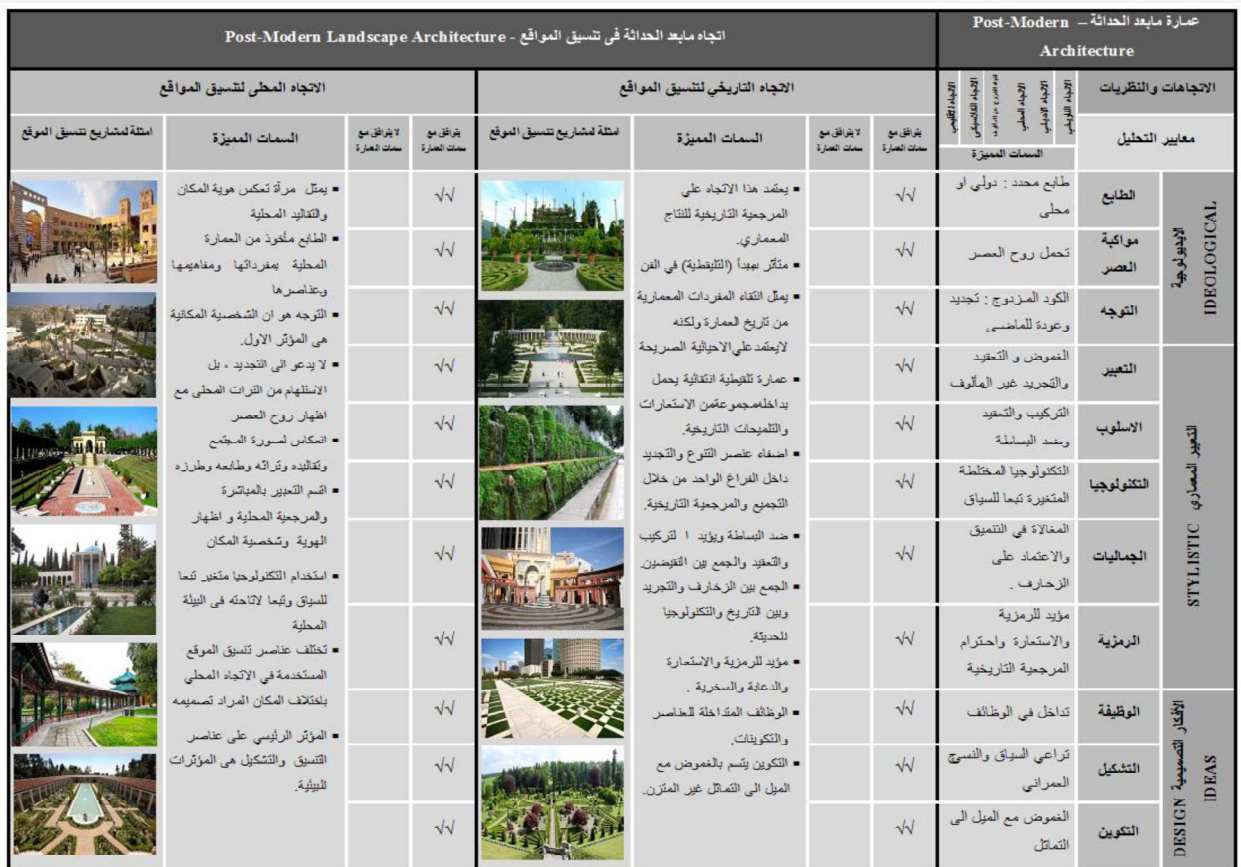
شكل 5 : سمات عمارة تنسيق المواقع في اتجاه ما بعد الحداثة